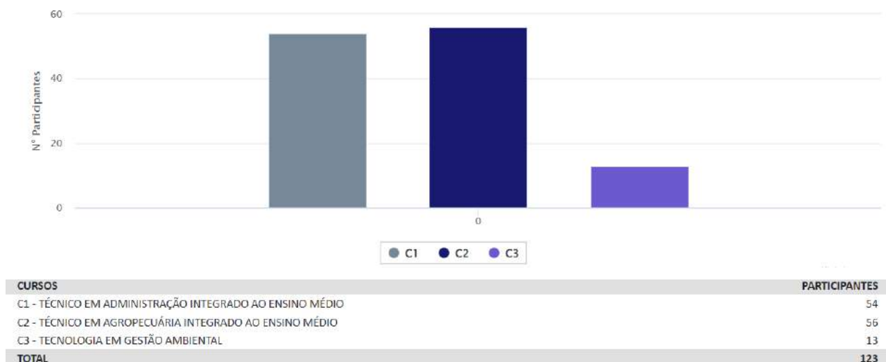
Gráfico 1 - Participação dos estudantes na avaliação no ano de 2021, em números absolutos

Na Tabela 2 observamos a participação dos segmentos da comunidade acadêmica, em números absolutos, no ano de 2021. Encontram-se os respondentes e os aptos a responder. E a participação percentual dos segmentos é apresentada no Gráfico 2.